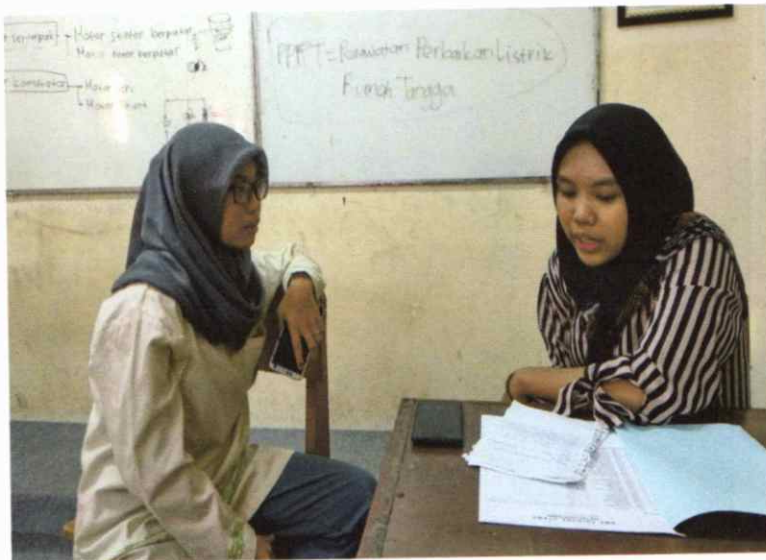
Wawancara dengan Siswa Kelas XII