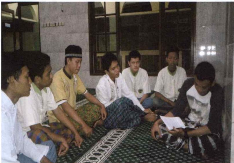
Kegiatan Pembinaan Boarding School