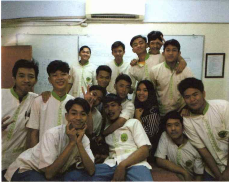
Siswa Kelas XII Jurusan Elektro