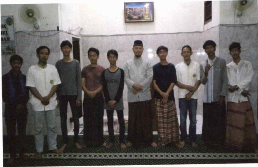
Siswa Pembinaan Boarding School