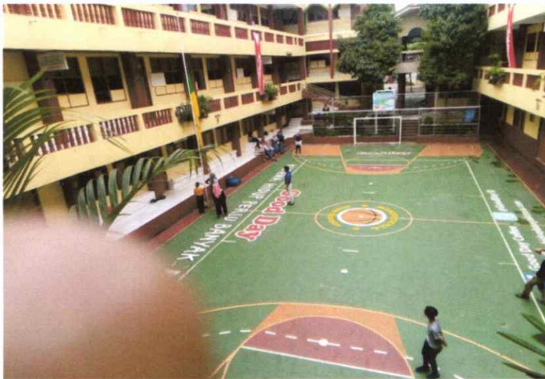
Keadaan Sekolah SMK Triguna Utama