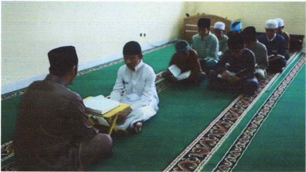
Suasana Setoran Tahfidz di Halaqah Tahfidz Asrama Putra