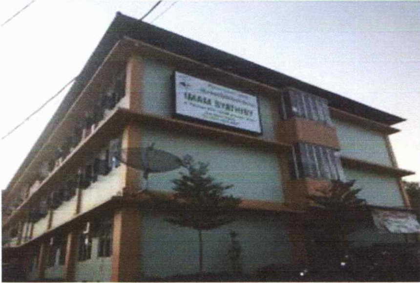
Dokumentasi Bangunan Pondok Pesantren Al-Imam As-Syathiby