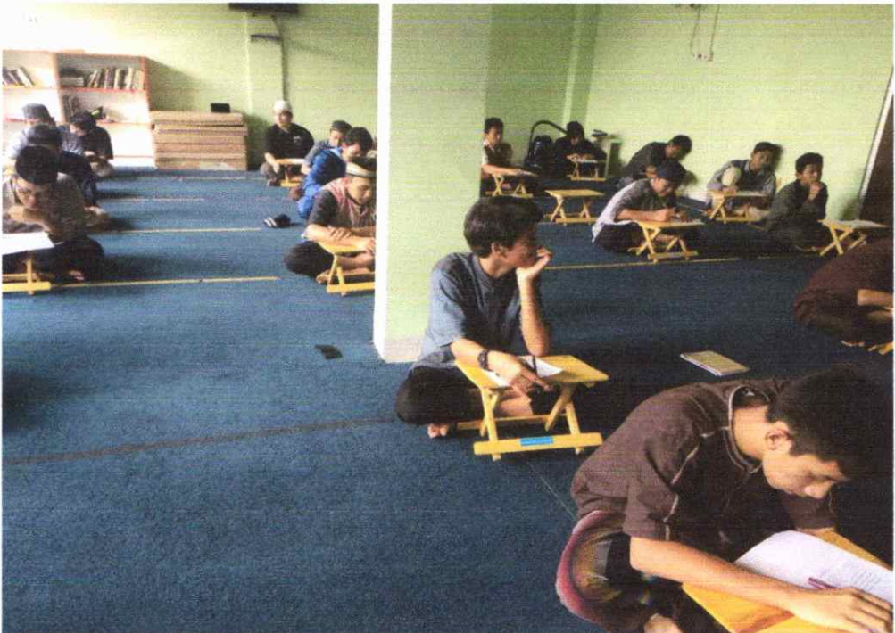
Suasana Ujian Bahasa Arab di Asrama putra