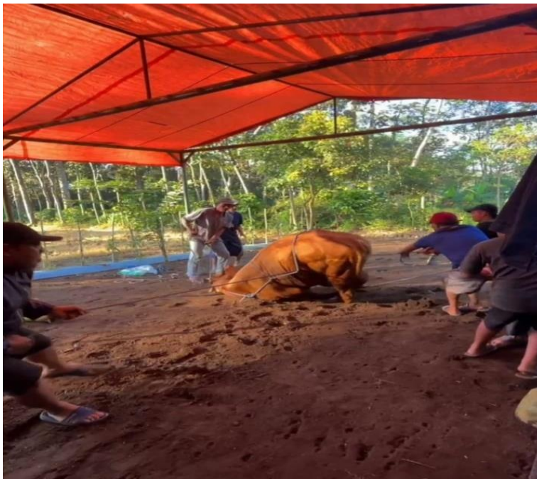
Pemotongan Hewan Kurban