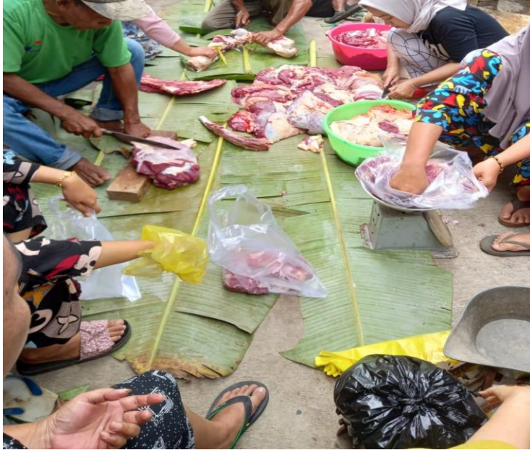
Pelaksanaan pembagian daging kurban