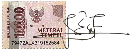
Aisyah Al Khoirunnida'