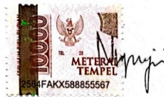
Nur Azizah Angraini