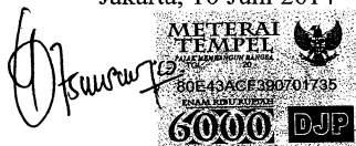
Siti Chusnul Chotimah